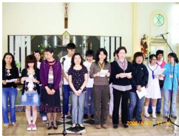
主日學導師們高歌助慶